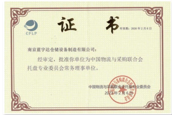
托盘专业委员会常务理事单位