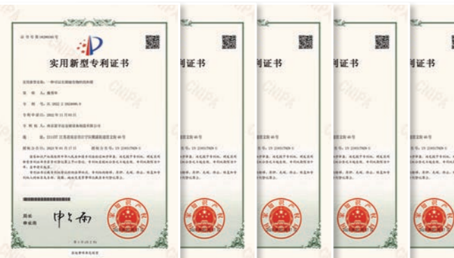
实用新型专利证书