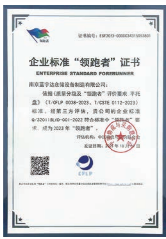
托盘行业企业标准‘领跑者’证书