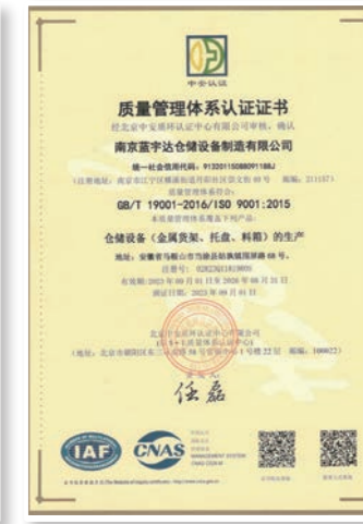
质量管理体系认证证书