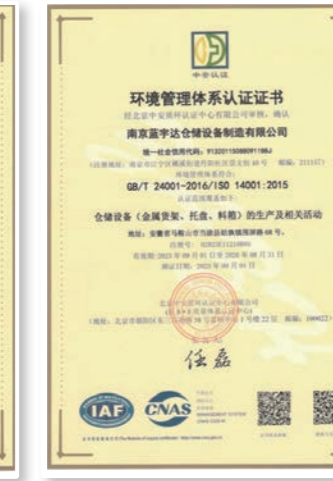
环境管理体系认证证书