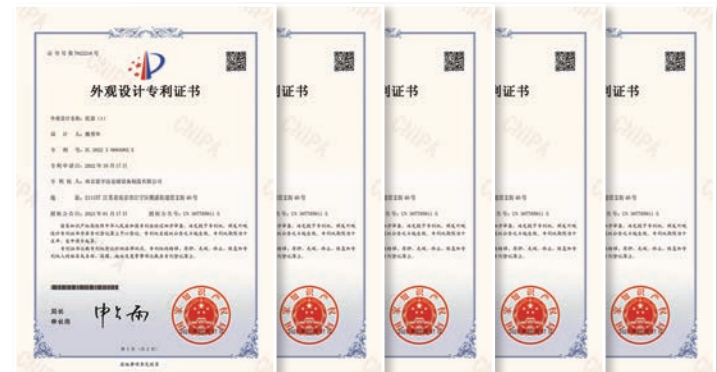
外观设计专利证书