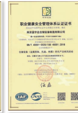
职业健康安全管理体系认证证书